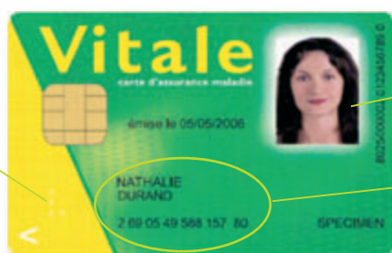
Photo de l'assuré